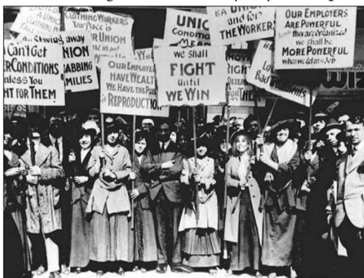
Víte, co se dělo v New Yorku v roce 1908?

„Ne, žena není lepší, ovšem ani horší než muž; to záleží na individuích,“ řekl mimo jiné osvícený Tomáš Garrigue Masaryk již v roce 1904. TGM, velmi moudrý muž, byl se svou ženou Charlottou zjedno v tom, že muž a žena jsou rovnocenné bytosti, což v tehdejší společnosti rozhodně nebylo samozřejmé. Stejně jako to, že si Masaryk vzal jméno své ženy. V bývalém Československu šly ženy poprvé k volbám v roce 1919. V nejstarší republice světa San Marínu se tohoto práva dočkaly až roku 1960, ve Švýcarsku teprve za dalších jedenáct let a v Lichtenštejnsku dokonce až v roce 1986.