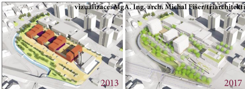
vizualizace: MgA. Ing. arch. Michal Fišer/tříarchitekti

dobu a místní úřad se snaží všechny nejasnosti a sporné body vyřešit. I to v diskusi opakovaně padlo a ukázalo se, že zapojení nezávislého odborníka