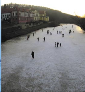
Zbraslav – bruslení na Krňáku