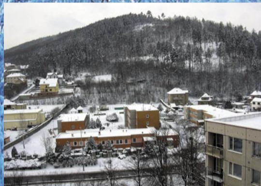
Radotín – Klapice