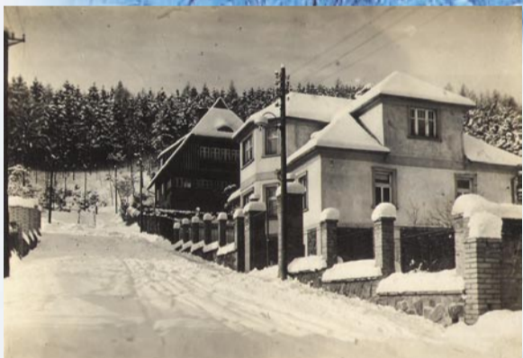
Zbraslav – dnešní Vančurova ulice, asi 30. léta