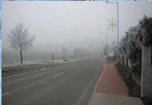
Lochkov – ulice Ke Slivenci