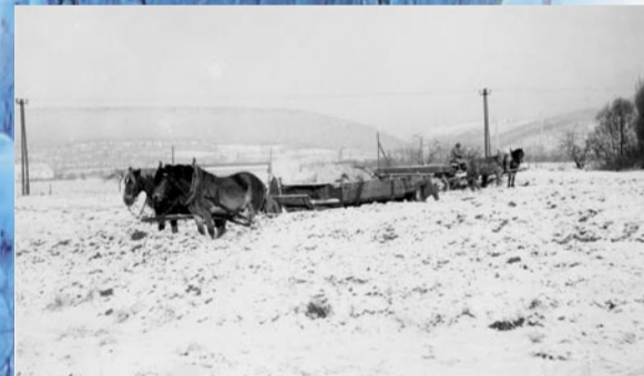
Zbraslav – u Peluňky