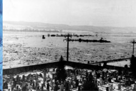
Radotín – povodně 1947