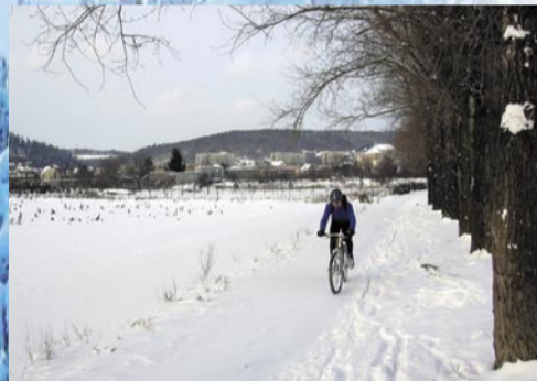
Radotín – cesta u Berounky