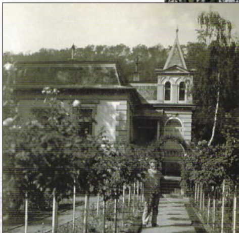
Vila zbraslavského právníka v Žitavského ulici postavená asi v roce 1890