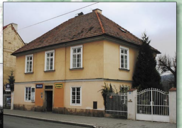
Vila vrchnostenského úředníka v ulici Elišky Přemyslovny s klasicistními prvky. Postavena ve 40. letech 19. století. Druhý snímek zachycuje dnešní stav