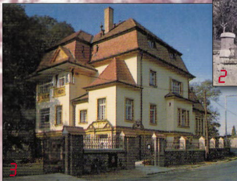
Vila v Bartoňově ulici postavená asi 1885. Na prvním snímku původní stav (asi 1890), dále po rozšíření (asi 1925), v polovině 90. let a dnešní podoba