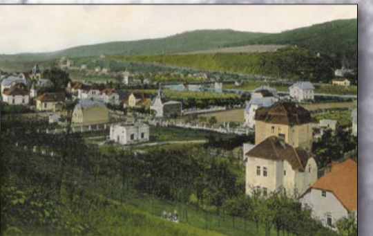
Soubor vil na pozemcích mezi Zbraslaví a Záběhlicemi z počátku 20. století a v první čtvrtině 20. století