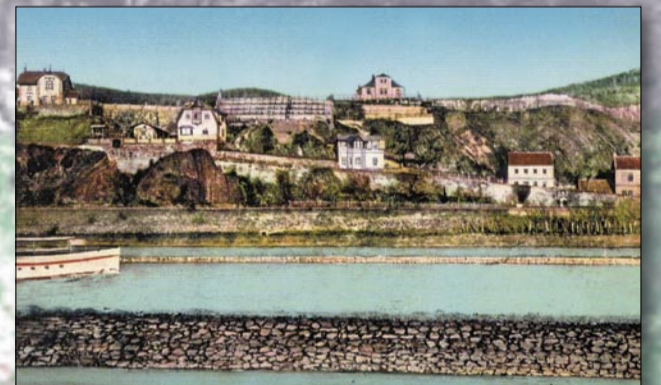
Soubor vil na Závisti na počátku 20. století