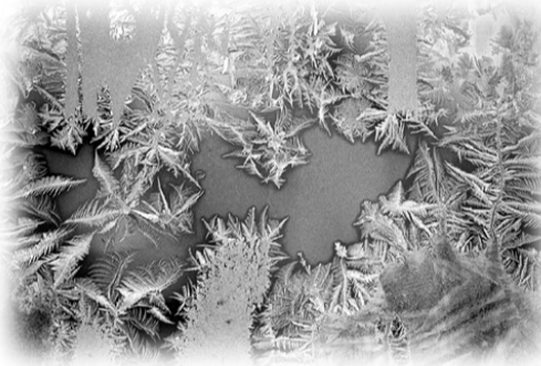
listopad a svátek sv. Martina.

dostal do Galie (dnešní Francie) a brzy se stal důstojníkem. Podle legendy v zimě, když projížděl městskou branou, spatřil chladem se třesoucího chudáka. Protože u sebe neměl nic, rozetnul mečem svůj plášť a polovinu mu daroval. Příští noc spatřil Ježíše, oděného půlkou jeho pláště, jak mluví k andělům: „Tímto rouchem mě oděl Martin, ještě nepokřtěný.“ A tak Martin na Velkou noc roku 339 přijal křest, svůj život zasvětil službě Bohu a odešel z armády.