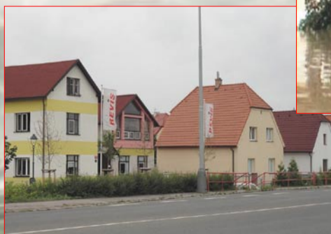
Kolem Výpádové má dnes většina domů nový kabát