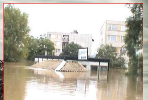
Naopak v nechráněné části jako by se zastavil čas (Výpádová ulice za tenisovými kurty)