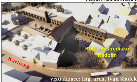
vizualizace: Ing. arch. Ivan Sládek Jedna z možných podob zástavby