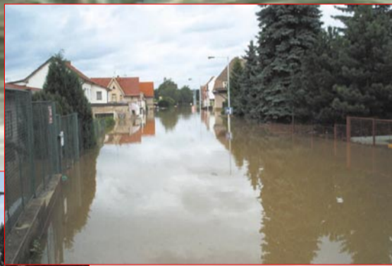
V roce 2002 všichni pochopili, proč se oblasti mezi ulicemi Výpádová a Vrážská říká Benátky (na snímku Věštínská ulice)