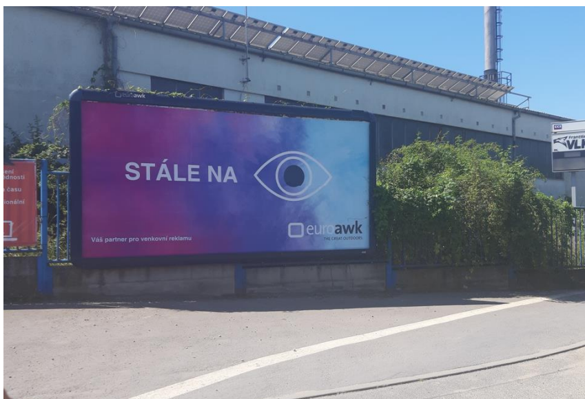
Stavba pro reklamu společnosti euroAWK s.r.o. evid. č. 5332, na pozemku parc. č. 215/5 v katastrálním území Lahovice