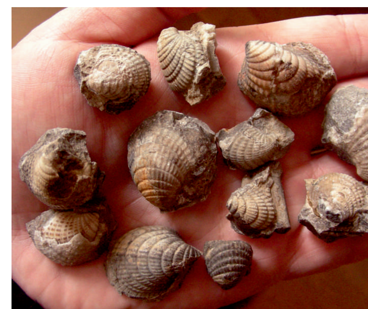
Zde nalezení mlži rodu Cardiolinka

Nedaleký Lochkov má v horní části svého obecního znaku modré pole se třemi stočenými schránkami hlavonožců, kteří upomínají na hojný výskyt zkamenělin v okolí, byť stočené formy patří k unikátům. Orthoceři jsou zde ale neskutečně hojní. Vápencové vrstvy jsou v horní části lůmku a suťových svazích tvořeny tisíci naplavenými kuželovitými schránkami orthocerů. Kromě nich se v sutích občas vyskytují zahnuté a výjimečně též zmiňované stočené formy, četní jsou i mlži, zato trilobiti patří k relativně vzácným zkamenělinám.