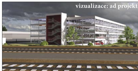
Parkovací dům na místě dnešního P+R přímo u vlakového nádraží

V Novinách Prahy 16 č. 7-8/2016 jsme přinesli podrobnou zprávu o důvodech zavádění nových opatření a změn, které měly přinést více jistoty pro místní