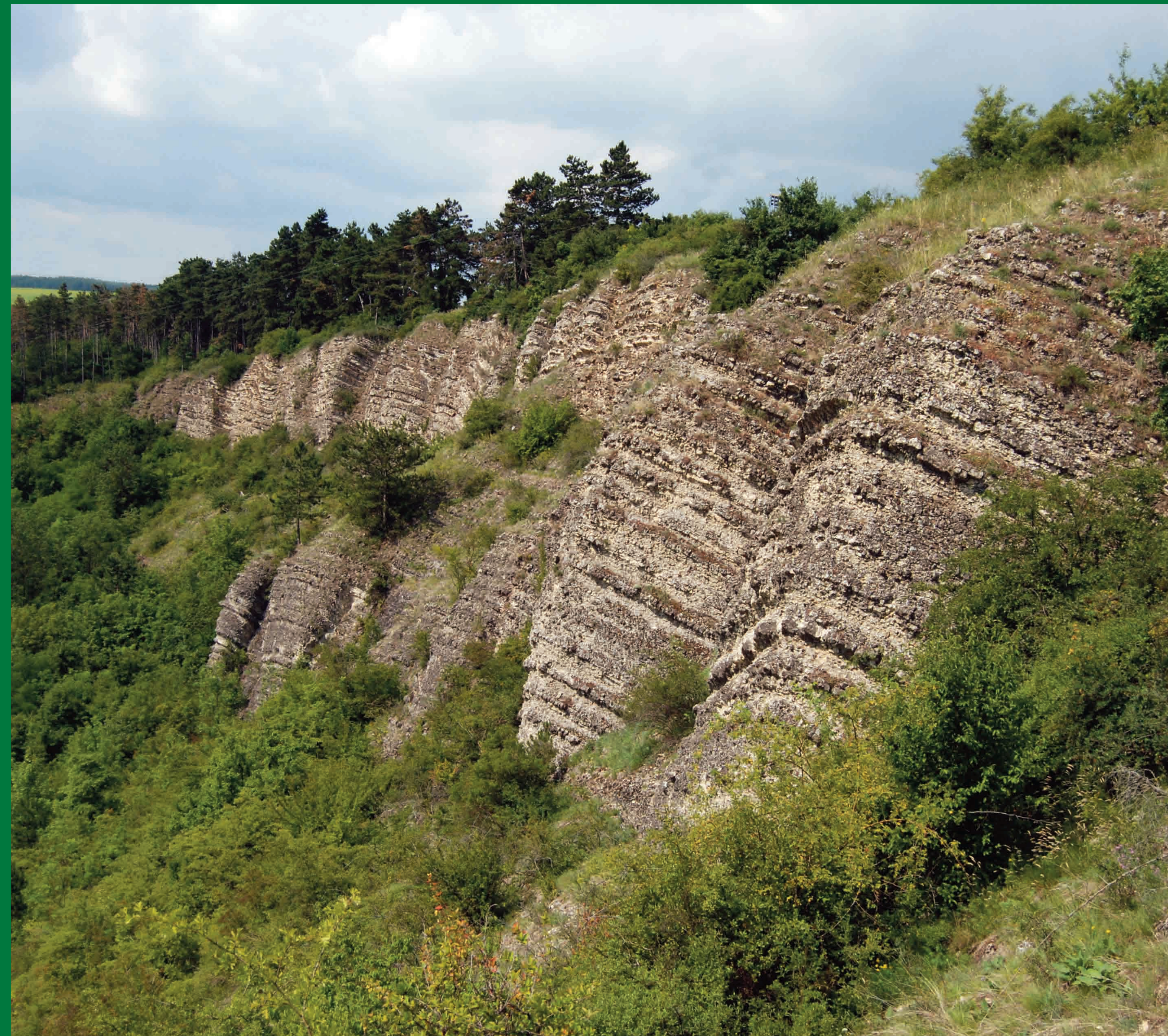
Sudy jsou geomorfologické tvary tvořené devonskými vápenci.