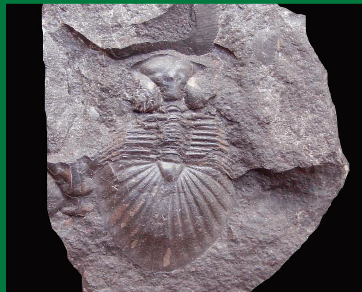
Spiniscutellum umbelliferum je význačný trilobit radotínských vápenců.