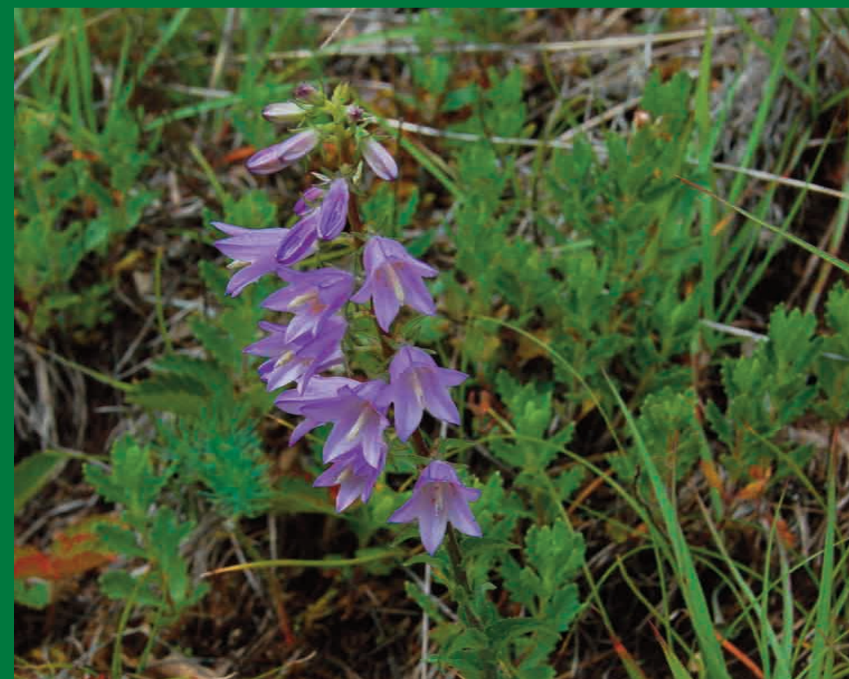
Zvonek boloňský láká hmyz na nektar.