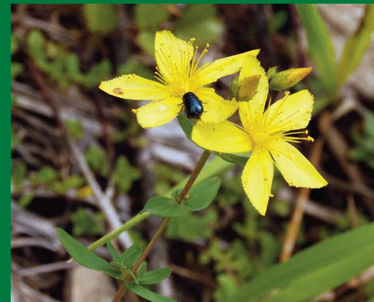
Třezalka ozdobná roste kromě Českého krasu nejblíže v Českém středohoří.