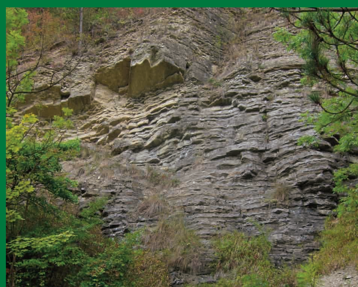
Profil s hranicí mezi lochkovským a pražským souvrstvím