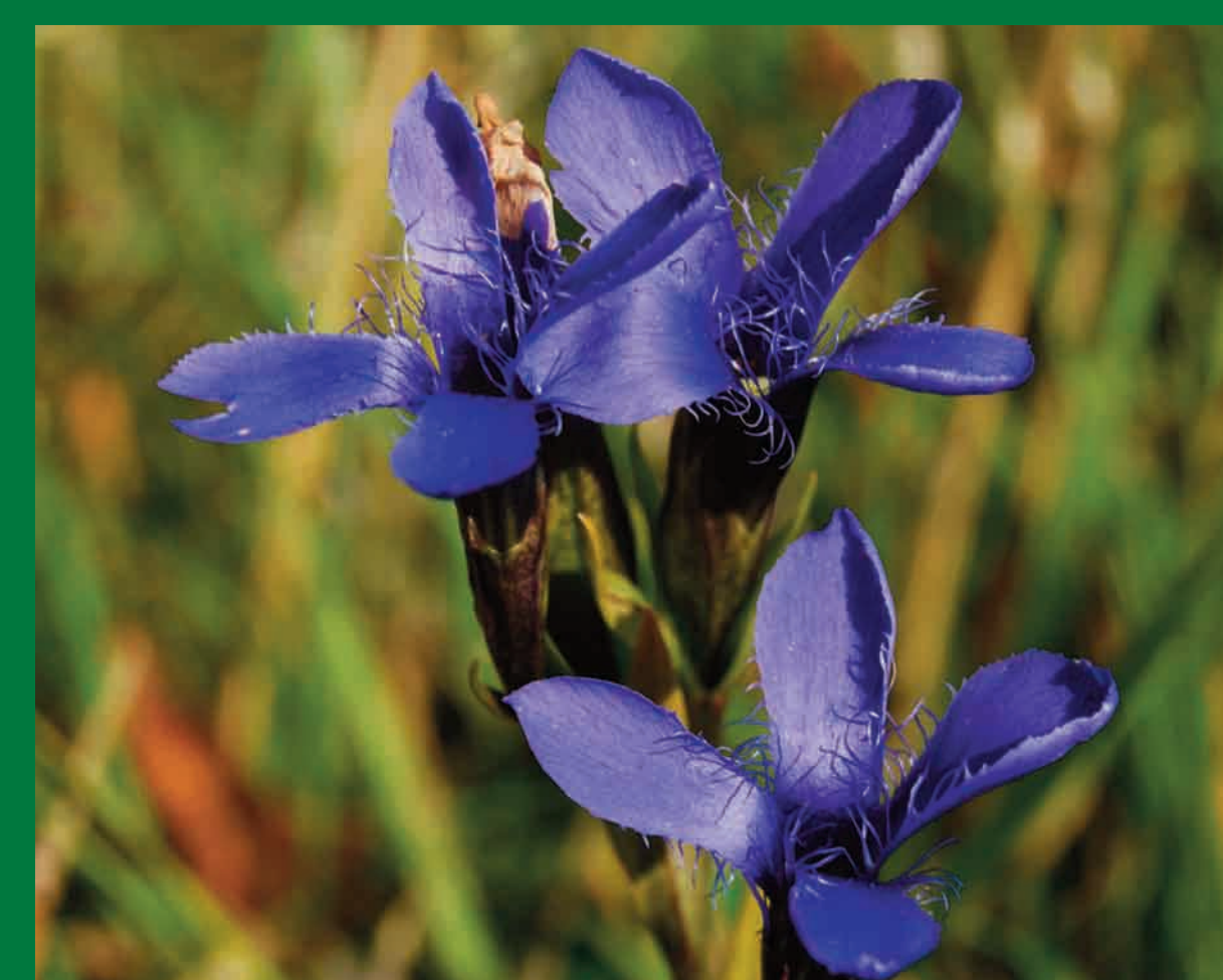
Hořeček brvitý kvete od srpna do října na dně opuštěných lomů.