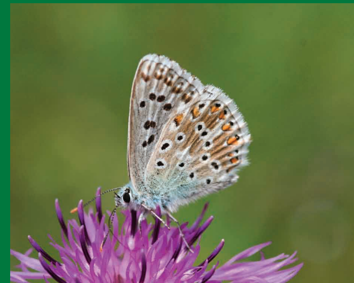
Modrásek vikvicový je letní druh výslunných stanovišť.