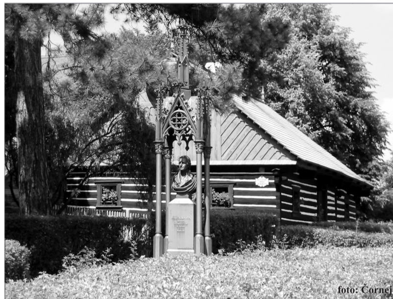
Hudlice - rodný dům Josefa Jungmanna