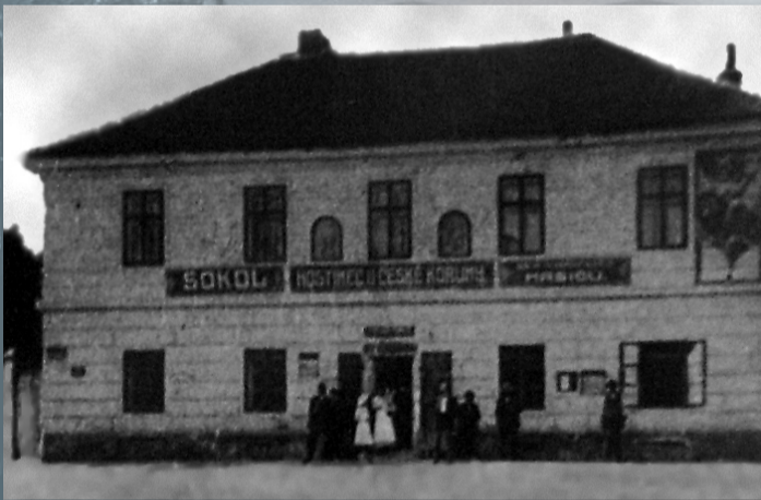
Hostinec „U České koruny“