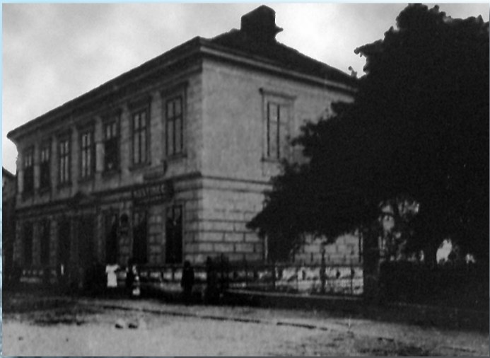
Hostinec „U Horymíra“