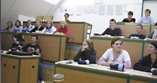
... a výuka dnes v matematicko-fyzikální učebně