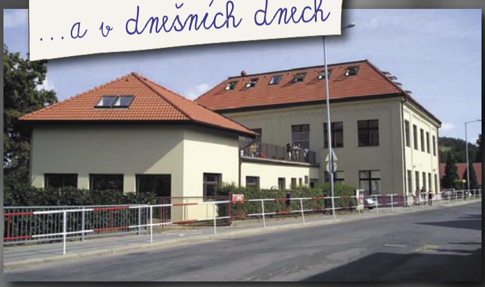
... a v dnešních dnech