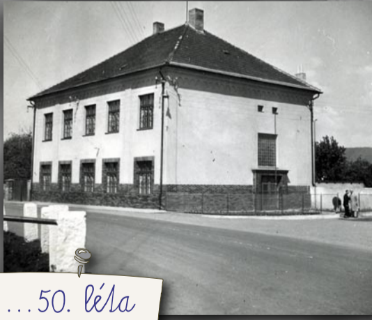
... 50. léta