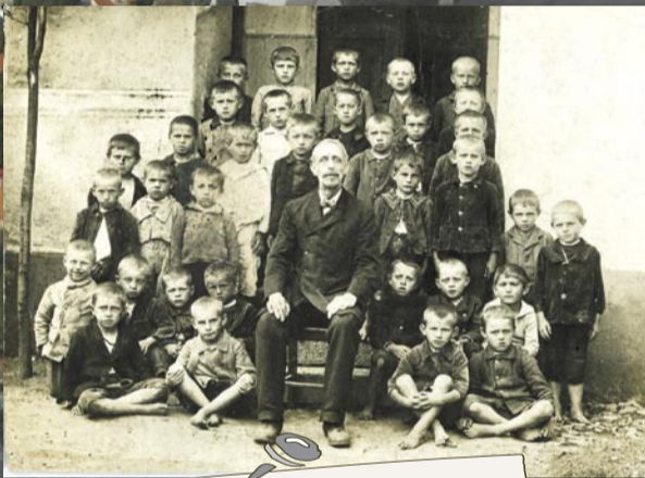
Chlapecká tůlka (1910)