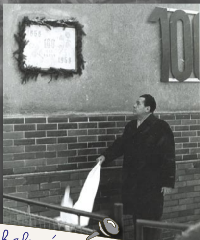
Odkalení pamětní desky ke 100. výročí (1968)

„Škola jest kolébka, ze které necht' vzejde blaho obce a státu“. Tato slova jsou uvedena na pozvánce ke 125. výročí školy v Lipencích z roku 1993. Jenomže lipenečtí loni oslavili již 140 let! Místní základní „alma mater“ byla totiž založena již v roce 1868. Jak se můžeme dočíst ve školní kronice, plán na budovu nakreslil pan J. Trnka, stavitel ze Smíchova. Návrh byl schválen 24. února 1868 a se stavbou se započalo 18. dubna. Škola byla stavěna povětšinou z kamene, který se vozil z knížecího lomu v Horních Mokropsích. Svěcení základního kamene bylo oslaveno velmi velkolepě 17. května 1868, tj. den po položení základního kamene k Národnímu divadlu v Praze. Samotné školní vyučování pak bylo zahájeno 2. listopadu 1868.