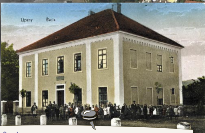
Jedna z nejstarších fotografií školy, asi 30. léta