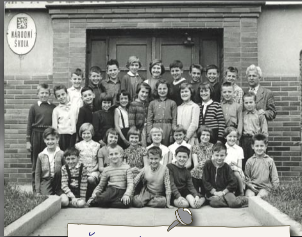
Školní rok 1958 - 1959