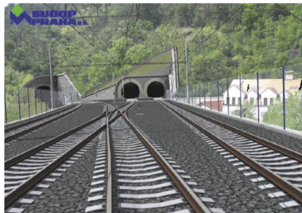
Portály Chuchle, vlevo odbočuje stávající trať do Radotína (ve výhledu dvojkolejná)

120 km/hod., se bezprostředně dotýká územní Chráněné krajinné oblasti (CHKO) Český kras, což nedovoluje