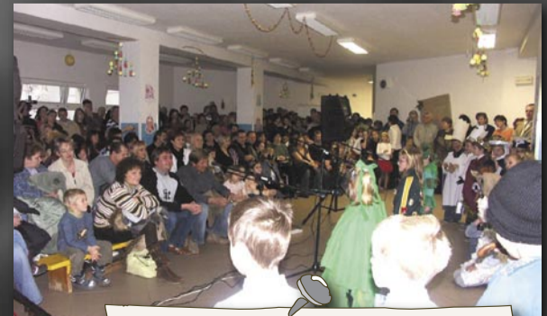
Vánoční dílny (2007)