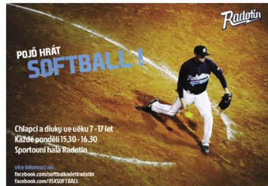
POJĚ HRÁT SOFTBALL! Chlapci a dívky ve věku 7 - 17 let Každé pondělí 15.30 - 16.30 Sportovní hala Radotín více informací na: facebook.com/softballradotin facebook.com/PSKSOFTBALL

let se počet mladých softbalistů v Radotíně několikanásobně navýšil. Dlouho tu byl jediný mládežnický tým – smíšené družstvo kluků a holek do 15 let. Pak vznikl tým juniorek do 19 let a samostatná družstva kadetů