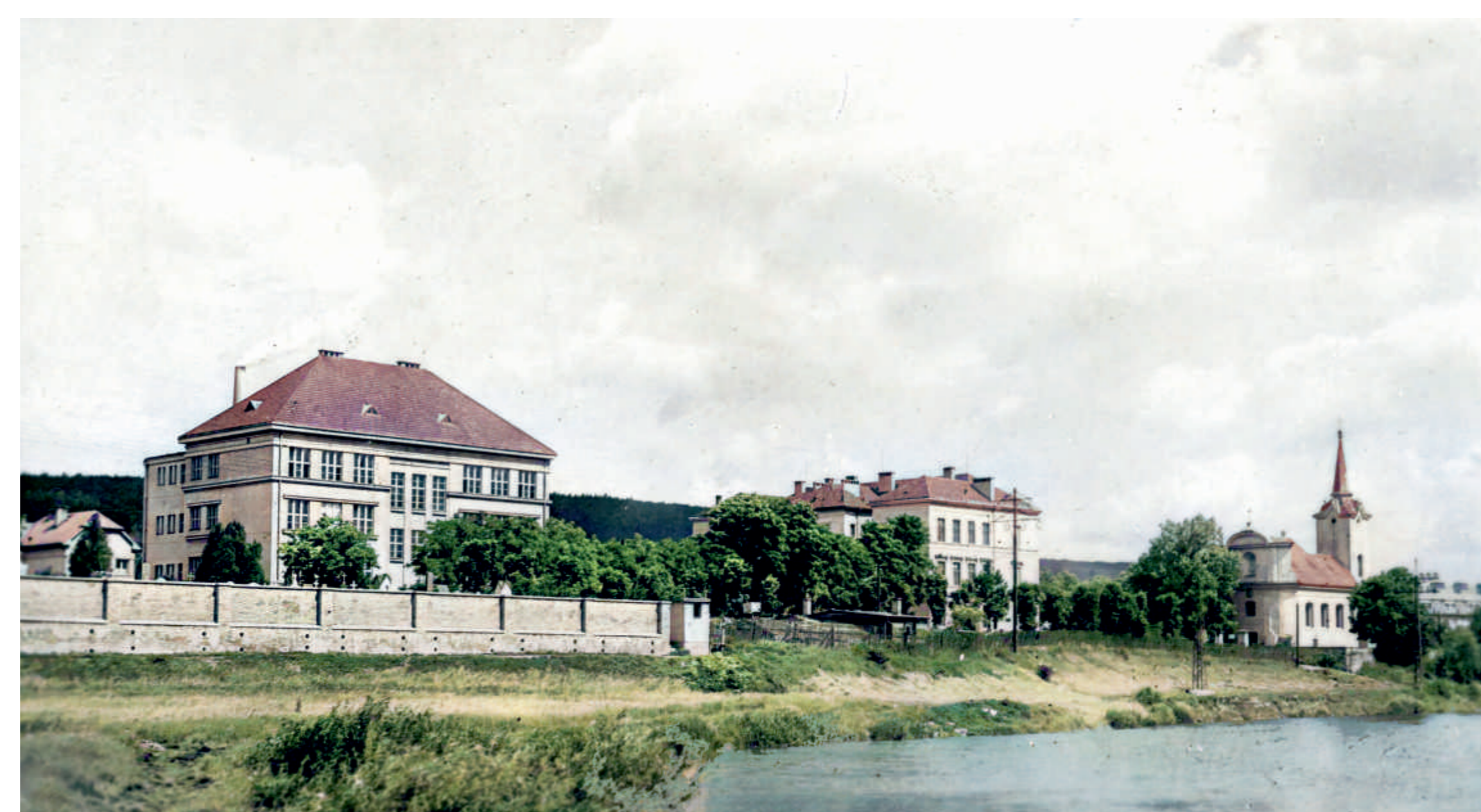
Pohled od řeky ke hřbitovu v roce 1940

Voda pro celý areál je čerpána ze 2 studen a čistí ji průtok nádrží s více než 6000 rostlinami 2 - trojúhelníková plocha mezi hřbitovem 1 a koupací částí 3. Ta má největší hloubku 3,15 metru, je naplněna 4500 m 3 vody a jako místo oddechu si ji každý rok vybere kolem 50 000 návštěvníků. Společně s bazénem 4 dotvářejí v republice zcela výjimečný školní a rekreační areál 5