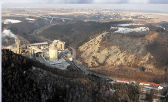
Trochu dál na sever, také roku 2011 – vpravo dole je vidět sběrný dvůr v ulici V Sudech, za cementárnou ční Lochkovský most Pražského okruhu