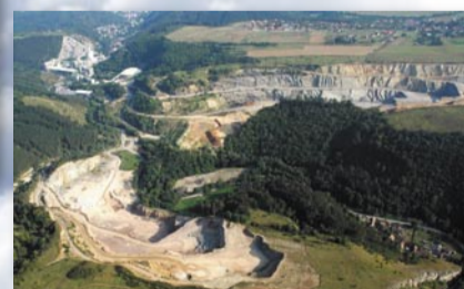
Pohled od východu v roce 2006 zabíral jak oba lomy (bližší je Špička, z druhé strany údolí vybíhá Hvíždalka), tak i v pravém dolním rohu je vidět zástavba Cikánky