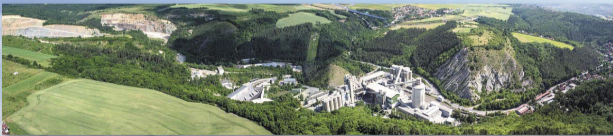
Na panoramatickém záběru z roku 2014 je dobře vidět celá severozápadní část od Edenu v pravé části, přes cementárnu až k oběma lomům zcela vlevo. Letadlo bylo právě nad Sudy, vlevo dole vykukuje první dům Kosoře

Druhý díl věnovaný Radotínu nahlédne na tu jeho část, která zabíhá dlouhým klikatým údolím kolem Radotínského potoka mezi přilehlé kopce a do značné míry z nich i „ujíždá“ – za čtvrtí Eden se totiž nachází cementárna zásobovaná surovinou z lomů Hvíždalka a Špička.