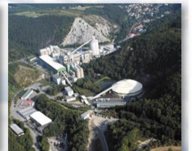
Stále v roce 2006 – opačný záběr cementárny odhaluje původní mlýnskou nádrž (vlevo od kruhové haly), jejíž voda se dnes používá k chlazení