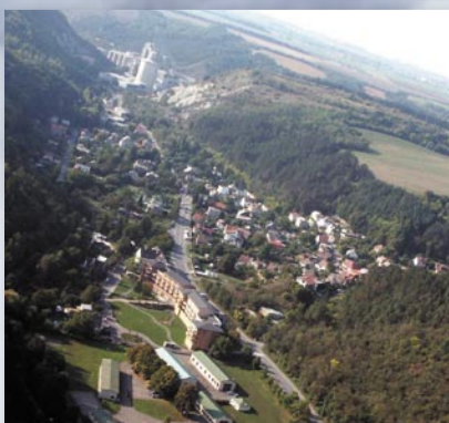
Fotografie z roku 2003 zabírá (odspodu) část učiliště, dům s pečovatelskou službou, Eden a zcela vzadu cementárnu