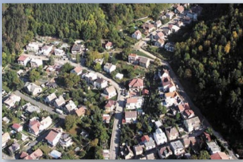
2003: detailní pohled na Eden

Celá čtvrt zabraná od severu v roce 2011: dobře jsou patrné linie klikatícího se potoka, vpravo pod kopci drážky do cementárny, na opačné straně pak ulice U Drážky, která kopíruje původní vedení kolejí a uprostřed rovná linka ulice K Cementárně. Přímo pod křídlem je vidět dvůr Hasičské stanice č. 8 Hasičského záchranného sboru hl. m. Prahy