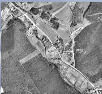
Výřez mapového snímkování z roku 1938 zobrazuje tehdejší rozvolněnou zástavbu v Edenu. Na většině úrodné půdy se pěstovala zelenina, zahradnické výsadby jsou patrné i tam, kde dnes stojí nový dům s pečovatelskou službou

Křižovatka, na které se rozcházejí cesty na Cikánku a do Lochkova, v roce 1945 vypadala docela jinak. Pod Homolkou ještě stál mlýn Přední Mašek, z něhož se do současnosti zachovala jen mlýnská nádrž, cesta procházelo nedaleko od něj dnešním areálem cementárny a překlenovala ji původní drážka z lomů