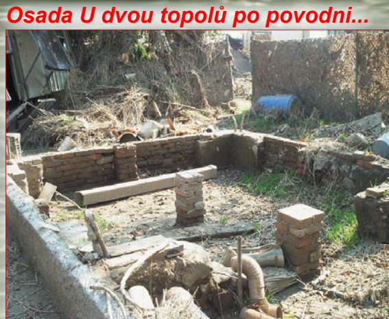
Osada U dvou topolů po povodni...