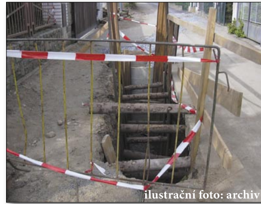
ilustrační foto: archiv

Celková předpokládaná hodnota investiční akce činí 66,3 mil. Kč bez DPH. Po schválení záměru veřejné zakázky v Zastupitelstvu hl. m. Prahy následuje odeslání předběžného oznámení veřejné zakázky na Věstník