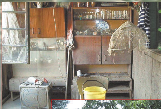
Osada V břížkách po povodni...