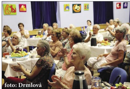
I před vsutku letní počasí bylo plno