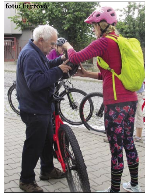
Jízdy na elektrokolech se znovu chystají v příštím roce