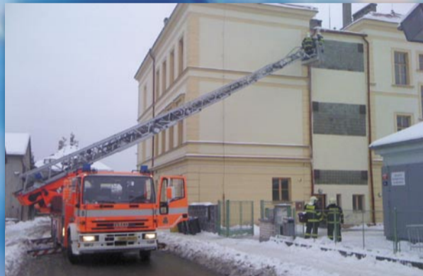
Hasiči zasahují ve školním areálu (Loučanská ulice, 14. ledna)