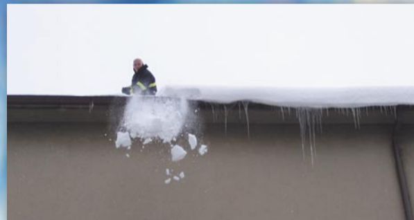
Dobrovolní hasiči shazují nebezpečné převisy ze střech (Sídliště, 13. ledna)