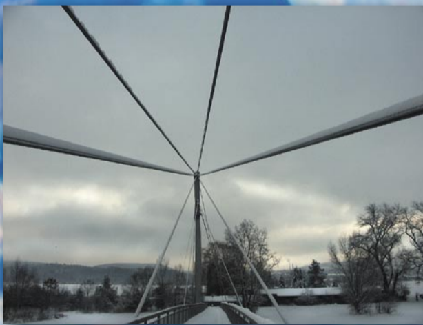
Lávka přes Berounku