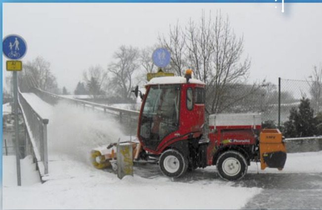
První nasazení techniky (stroj Rondó, ulice Václava Balého, 8. ledna)