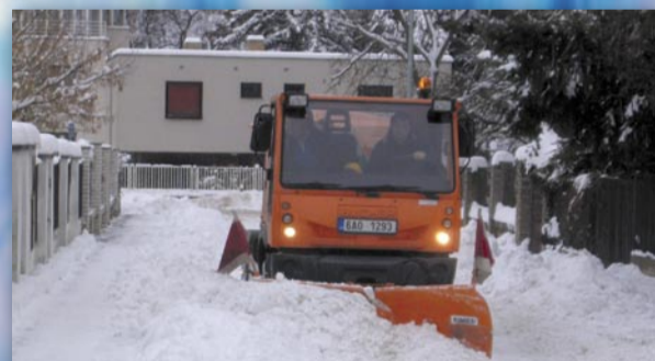
Zbraslavský víceúčelový stroj Bucher v akci (ulice Na Královně)