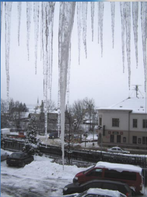
Ledová krása... ale také hrozba (náměstí Osvoboditelů, 12. ledna)