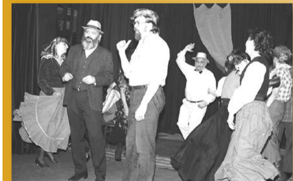
Úvodním představením obnovené činnosti činoherních ochotníků bylo v roce 1991 jevištní pásmo písniček a kabaretních scének na „staropražský folklor“ Sebrala patrola

Neznamená to však, že bychom se zbraslavskému divadelnictví již poté nechtěli věnovat - doposud jsme ani nenačali historii zdejšího stále oblíbeného loutkového divadla a čeká nás i ohlédnutí za již zaniklým lesním divadlem. Ale to až někdy příště. Nyní se vracíme o pár let zpět - v roce 1988 byla v rámci akce „Pražané svému městu“ otevřena nová divadelní budova na Zbraslavi, nyníjší Divadlo Jana Kašky. Divadelní jevištní technologie byla řešena univerzálně, tedy umožňují inscenování nejen loutkových představení všemi druhy loutek, ale i představení činoherní. Od první premiéry v roce 1991 do dnešních dnů soubor nastudoval celkem 46 her. S ohledem na společenské změny po roce 1989 vzniklo v roce 1991 občanské sdružení Zbraslavská kulturní společnost. Základní idea k založení společnosti vzešla od členů loutkářského souboru, který v té době již několik let úspěšně pracoval pod tehdejšími Kulturním domem MNV ve Zbraslavi. Hlavní činností společnosti je provozování loutkového a činoherního divadla pro děti i dospělé.