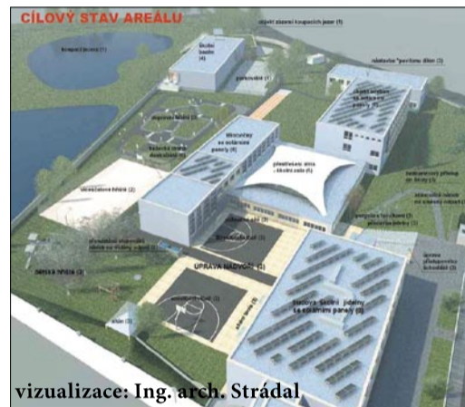
Od jara 2014 zažívá rozlehlý areál radotínské ZŠ nebývalé proměny

Ve výběrovém řízení získala zakázku firma AREN VT s.r.o. s nejnižší nabídkou lehce pod hranici 10 mil. Kč bez DPH. Vlastní stavba začne 15. června a nezasáhne do