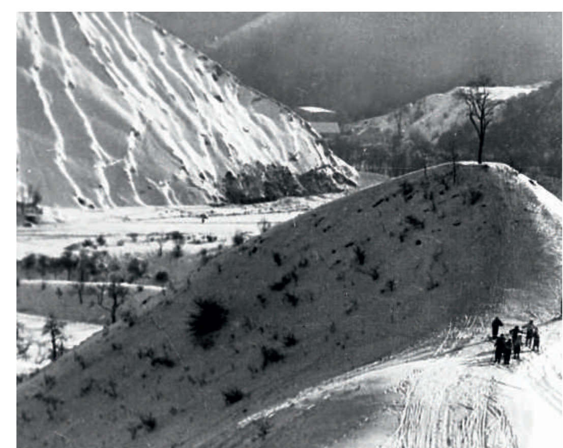
Lyžování na Homolce, na dohled starého lomu

V levé části lomu se vyskytují šedé dvorecko-prokopské vápence s hojnou faunou především trilobitů a hlavonožců a v pravé části, směrem ke studánce, pak starší černé vápence a břidlice lochkovského souvrství, z nichž se pod Kosoří ručně vyráběly dlažební kostky.