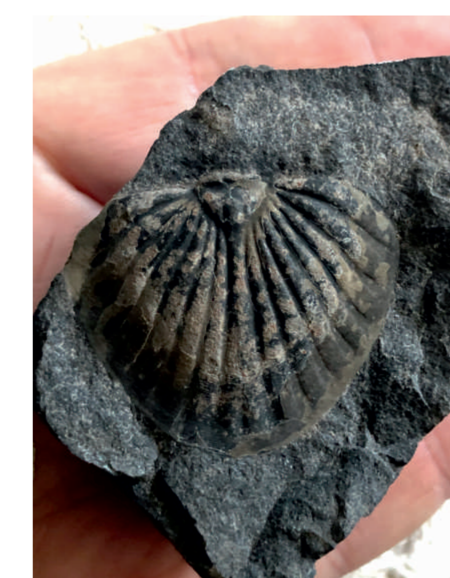
Ocasní štít trilobita Spiniscutellum umbelliferum z lochkovských vrstev radotínských skal