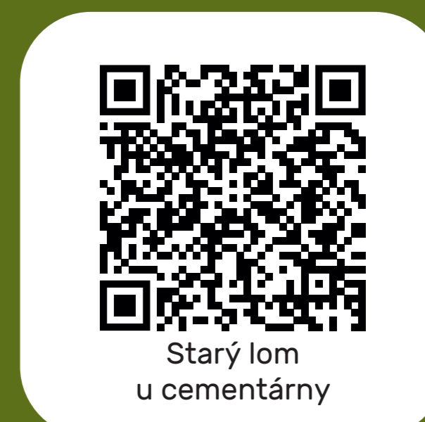
Starý lom u cementárny

Stezku zajistila v roce 2022 svými prostředky Městská část Praha 16