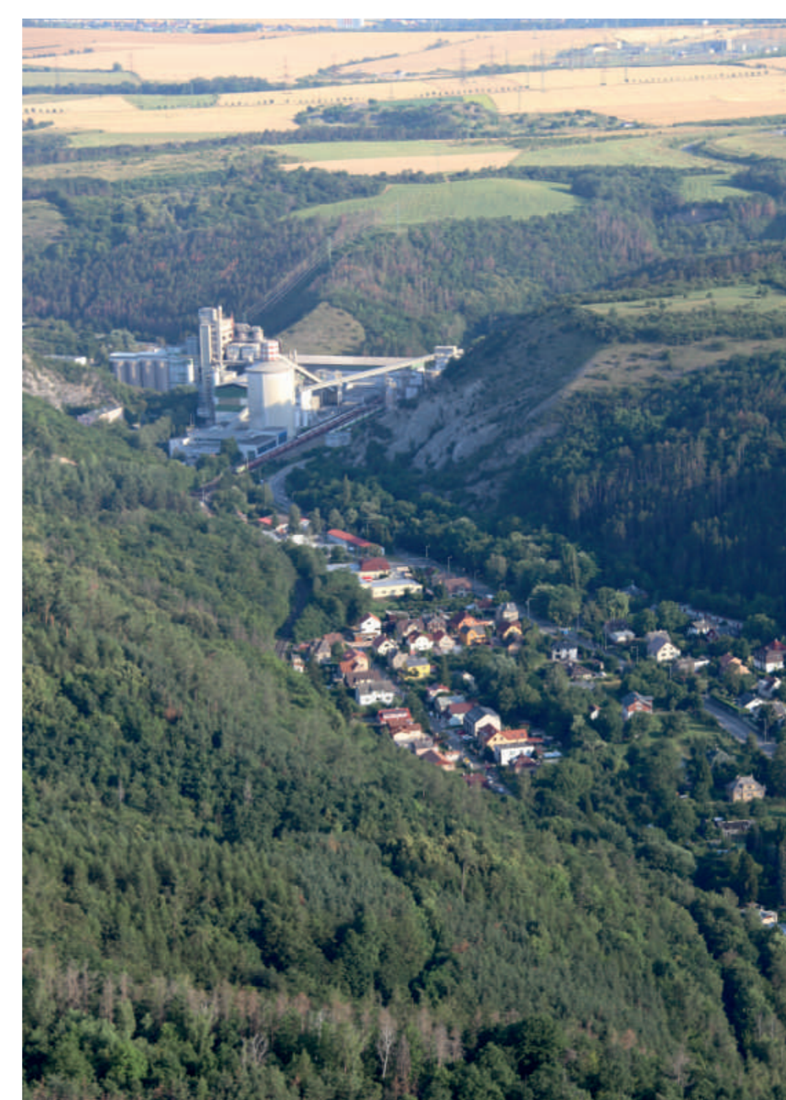
Radotínské údolí z ptačí perspektivy – vpravo od cementárny přírodní památka Radotínské skály, za ní v roklině skrytý Orthocerový lůmek