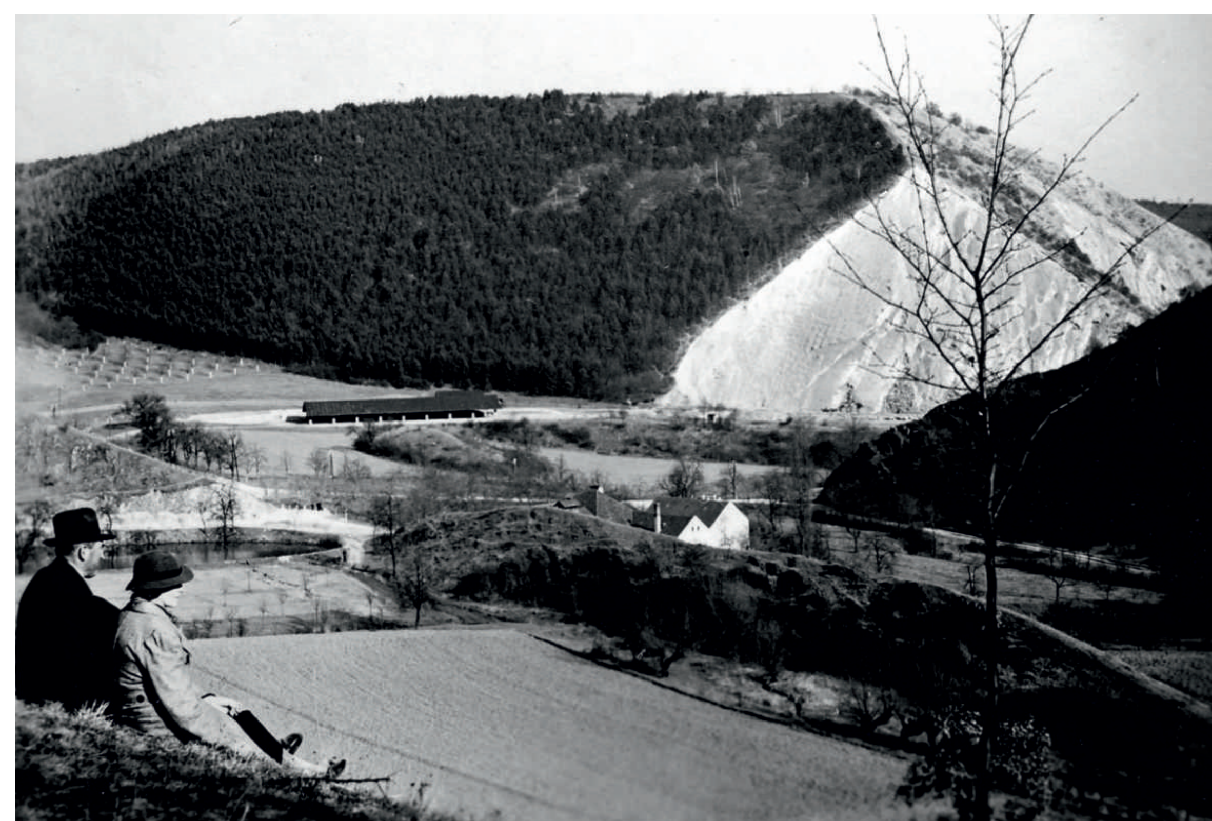
Mlýn Přední Mašek, dnes nová cementárna. V pozadí návrší s lomem, kde právě stojíte