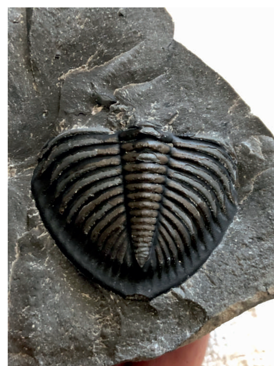
Ocasní štít trilobita Odontochile hausmanni