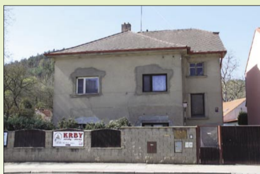
Současná podoba vily