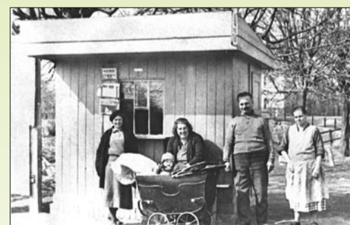
Na strategickém místě u můstku vyrostla maličká trafika Kadlecových, čelem byla otočená do silnice (nyní ul. Prvomájová), stejnou podobu má i na snímku z r. 1959