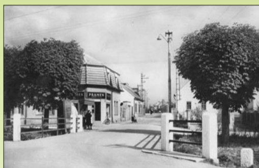
Prodejna Pramene v roce 1959