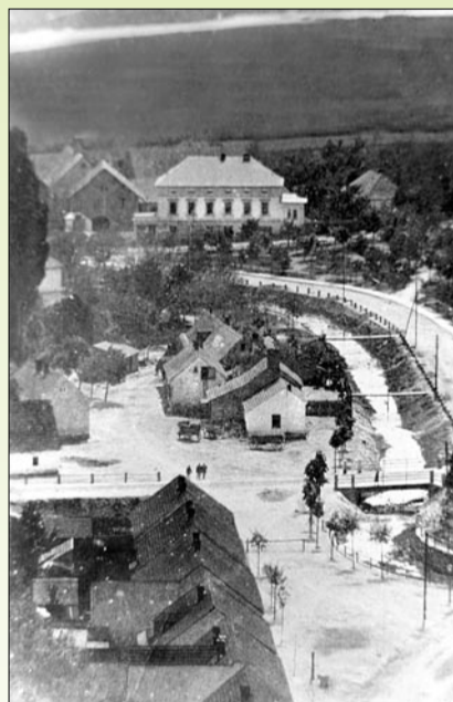
Na snímku pořízeného kolem roku 1900 byla parcela s budoucím čp. 299 ještě prázdná, stejně jako protilehlé místo u potoka