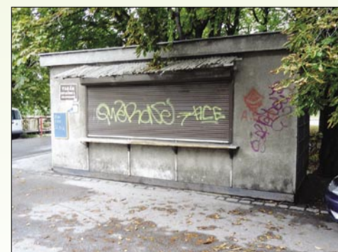
Dřevěnou budku později nahradila stavební buňka, která tu stála ještě v roce 2012

Historické snímky poskytli Ing. Irena Farníková, pan Otakar Jahoda a z letopiseckého archivu Ing. Jaroslav Šindelka, současnou podobu nafotila a textem doprovodila Kateřina Drmllová