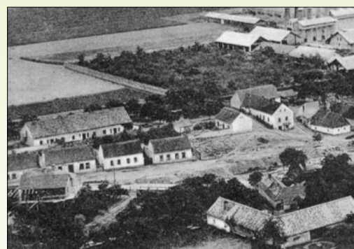
Již hotový dům na snímku z roku 1910 najdete vlevo dole, protilehlá linie domů ještě není uzavřena