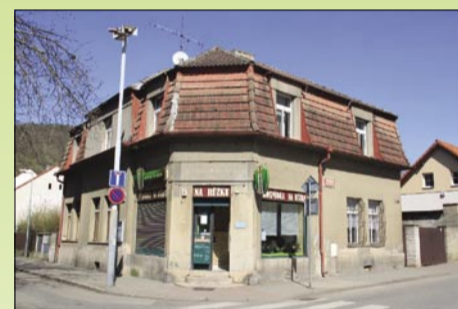
Dnes se zde můžete zastavit v Hospůdce Na růžku