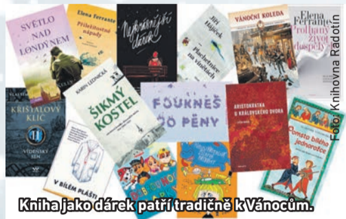
Kniha jako dárek patří tradičně k Vánocům.

Mezi čtenáři naší knihovny patří již několik let mezi nejoblíbenější autory Vlastimil Vondruška. Horkou novinkou je část série Hříšní lidé Království českého s názvem Pomsta bílého jednorozce . Historický detektivní román nás zavede do poloviny 13. století, kde mladý královský prokurátor Oldřich