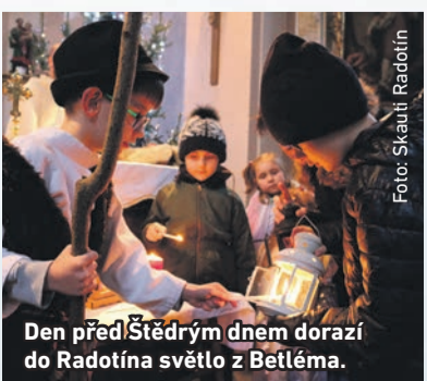
Den před Štědrým dnem dorazí do Radotína světlo z Betléma.

V e středu 23. prosince přivezou skauti do Radotína Betlémské světlo. Vyzvednout si ho bude možné v tento den mezi 15. a 17. hodinou v kostele sv. Petra a Pavla. Pokud bude kostel kvůli epidemiologickým opatřením uzavřený, světlo bude k dispozici na zahradě nedaleké skautské klubovny v ulici Nad Beroučkou.