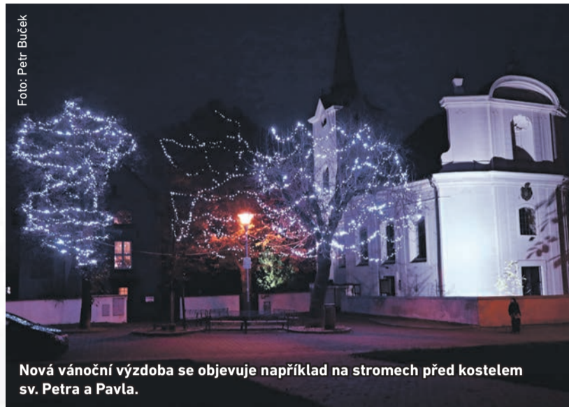
Nová vánoční výzdoba se objevuje například na stromech před kostelem sv. Petra a Pavla.

C entrum Radotína rozzáří během adventu a vánočních svátků nová výzdoba. Osvětlení se objeví na stromech na náměstí sv. Petra a Pavla, u autobusového terminálu mezi Vrážskou a Věštinou ulicí, na starém sídlišti a v Karlické ulici. Dekory v podobě svítících závěsů, hvězd a koulí ozdobí ulice Na Betonce, Vrážskou či Václava Balého, před budovou radnice bude stát 4,5 metru vysoký vánoční strom.