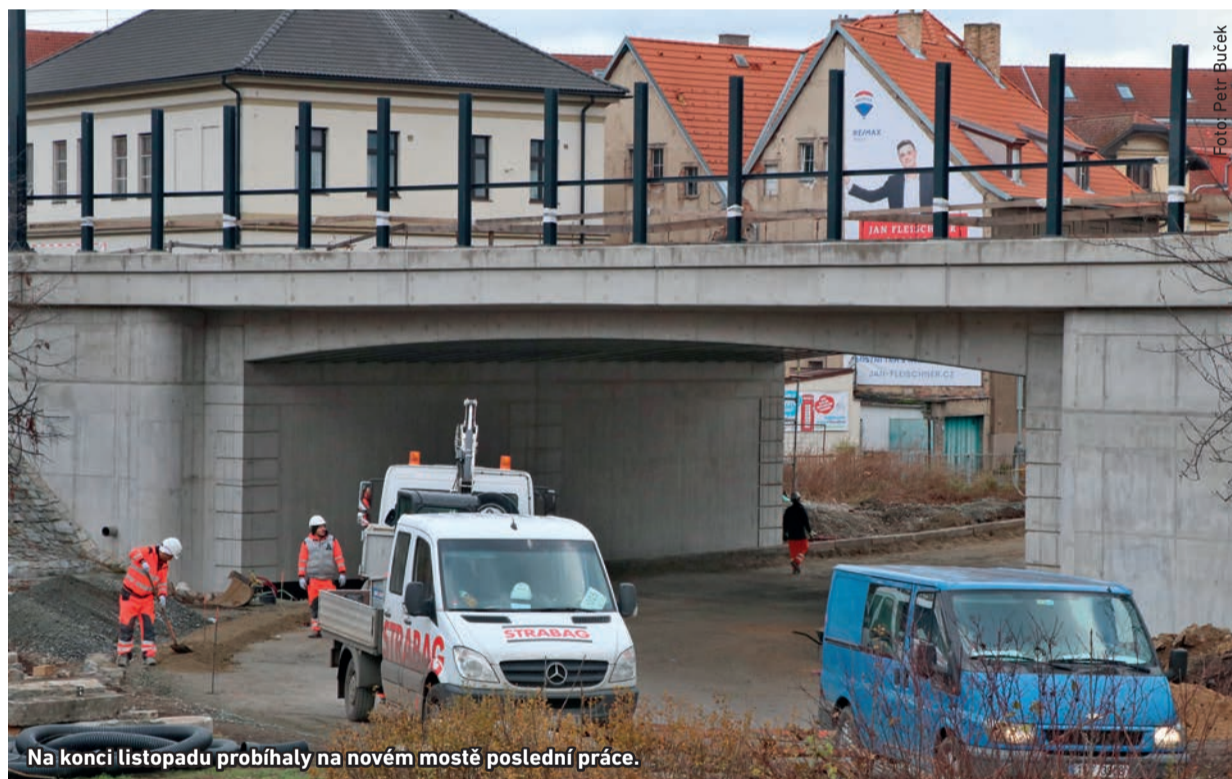
Na konci listopadu probíhaly na novém mostě poslední práce.

Od letošního března byl zavřený podjezd pod tratí u Horymírova náměstí. Nový most už stojí a vrací se pod něj auta i chodci.