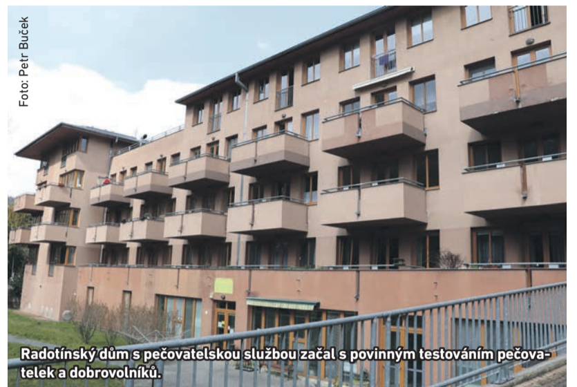
Radotínský dům s pečovatelskou službou začal s povinným testováním pečovatelů a dobrovolníků.

Po celý listopad platila v Radotíně stejně jako ve zbytku republiky celá