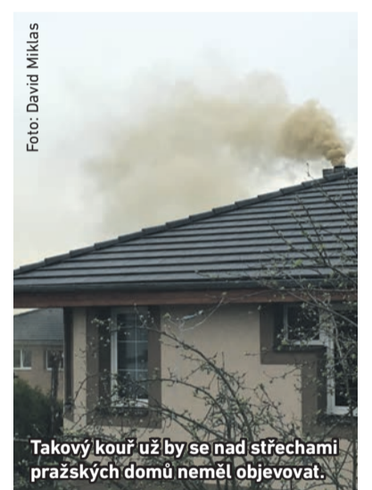
Takový kouř už by se nad střechami pražských domů neměl objevovat.