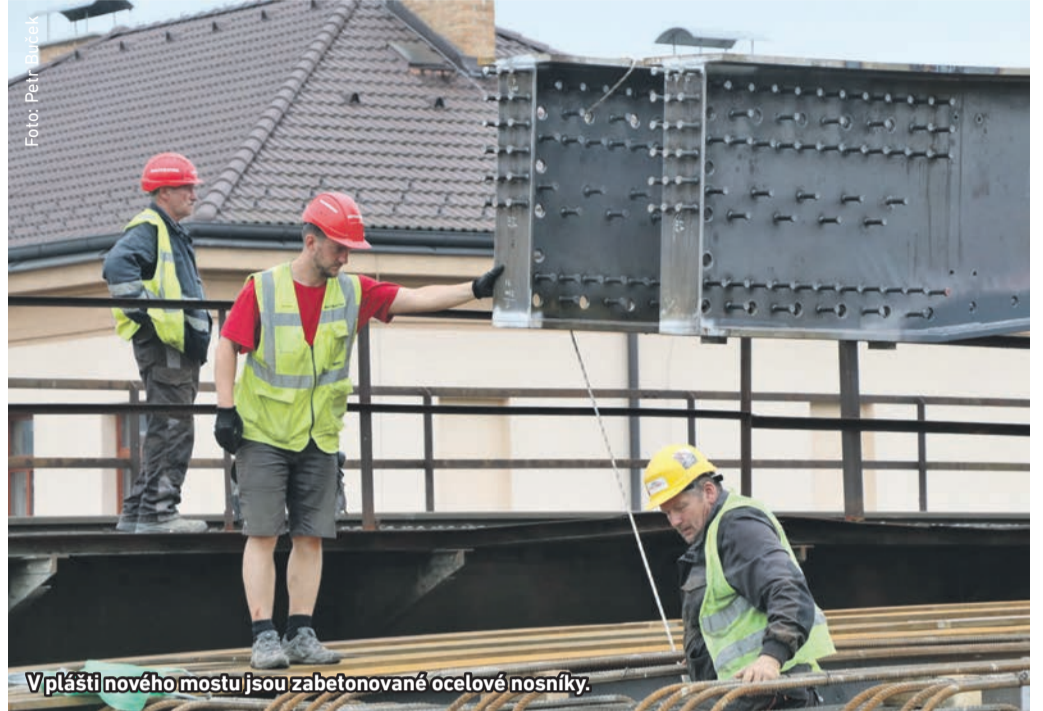
V pláštích nového mostu jsou zabetonované ocelové nosníky.