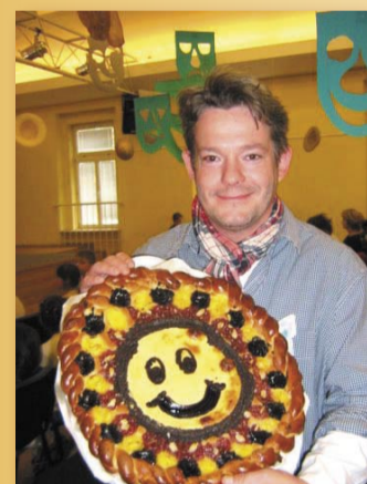
Patronát nad druhým ročníkem převzal známý herec a moderátor Aleš Háma, který se sem znovu vrátil v roce 2013

V roce 2011 na Radosti vystoupil i host ze zahraničí - soubor z Litvy Teatriukas (divadélčko) dokázal i přes jazykovou bariéru rozesmát malé i velké obecenstvo