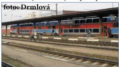
Závodní Esko na startu

Trasa vedla z radotínského parkoviště P+R na Anděl. Startovalo se ve čtvrt na devět ráno, tedy na vrcholu dopravní špičky. Do cíle dorazil jako první cyklista, krátce po něm „vlakocyklista“, jež volila pro cestu z Radotína vlak a ze smíchovského nádraží skládá kolo, následovaná těmi, kdo ze Smíchova na Anděl jeli tramvají. Teprve po nich