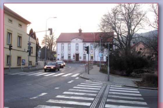
Materiály a text: Základní škola Praha - Radotín