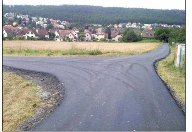
Nová asfaltka pro cyklisty a bruslaře