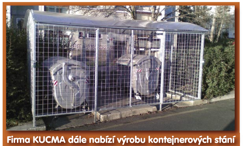
Firma KUCMA dále nabízí výrobu kontejnerových stání

V období od ledna do března 2010 sleva 10% na zakoupené zboží