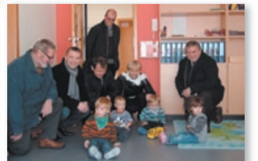
Návštěva v nově otevřeném předškolním zařízení (Burglengenfeld, únor 2012)