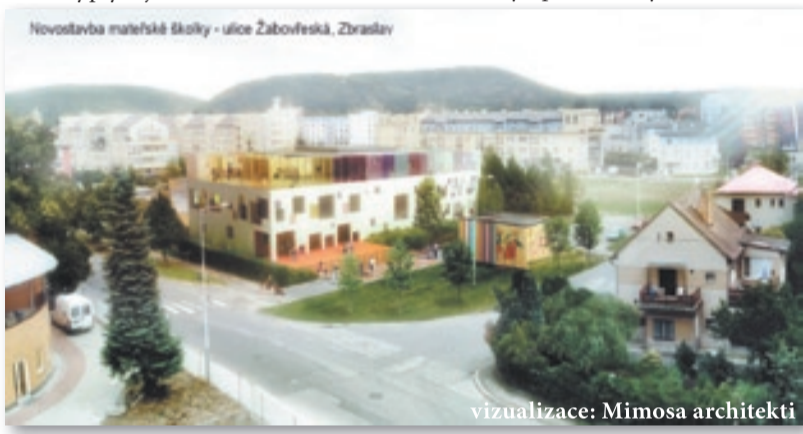
Novostavba mateřské školy - ulice Žabovřeská, Zbraslav