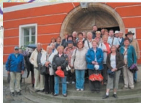
Radotínští seniři a letopisci na návštěvě partnerského města (červen 2012)