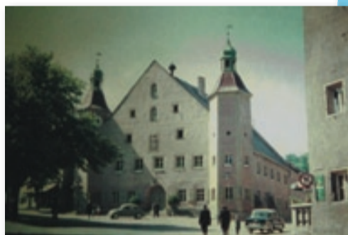
Burglengenfeldská radnice dříve a po rekonstrukci

V dnešním Objektivu času přinášíme jednak momentky z posledních oslav a řady (nejen loňských) návštěv a také pohled na proměny historického města v Horní Falci (městská práva od roku 1542) v posledních dvou dekadách, jenž se nejzásadněji týkají tzv. Naabtalparku, území nad městem, kde dříve stála vojenská kasárna. Po jejich opuštění armádou je dostalo k dispozici město a díky vzorné správě a úspěšnosti v získávání dotací se tato lokalita stala zásadní rozvojovou oblastí s novými školskými zařízeními, aquaparkem, sportovní halou či kinem.