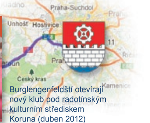
Burglengenfeldští otvírají nový klub pod radotínským kulturním střediskem Koruna (duben 2012)