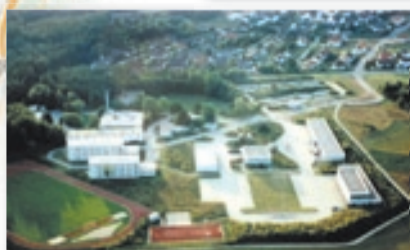
Naabtalpark, kdysi kasárna (historický snímek vlevo nahoře), dnes hlavní rozvojové území města