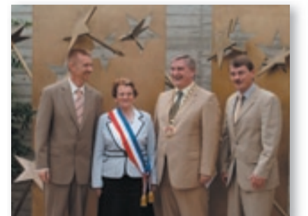
Evropské náměstí otevřeli hned čtyři starostové (květen 2009)