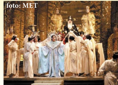
Kino Radotín uvede záznam z Metropolitní opery v New Yorku v neděli 15. března 2015 v 17.00 hodin. Délka: 2 hodiny 20 minut (1 přestávka)

Dirigent: Andris Nelsons Režie: Franco Zeffirelli Účinkují: Maria Guleghina, Marina Poplavskaya, Marcello Giordani, Samuel Ramey