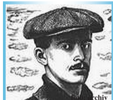
Průkopník české aviatiky Ing. Jan Kašpar