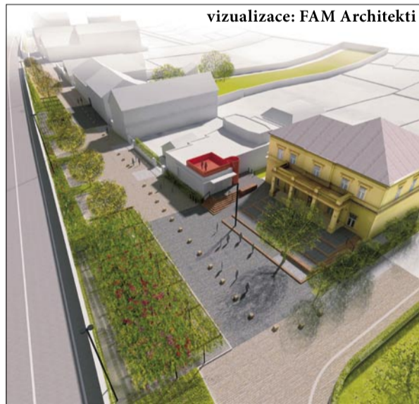
vizualizace: FAM Architekti

Městská část Praha - Zbraslav zadala v roce 2009 vypracování studie revitalizace prostoru ulice U Malé řeky a souvisejícího okolí - propojení s Městskou zahradou, podchodem pod komunikací K Přehradám a prostorem navigace řeky Vltavy „U přístavu“.