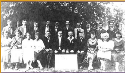
Ještě v roce 1919 hráli členové Dramatického odboru Československých kovopracovníků v Radotíně své představení odděleně i od ostatních radotínských spolků

Divadlo se v Radotíně hraje přibližně od 80. let devatenáctého století. Zpočátku šlo patrně opravdu o čistě místní zábavu, která ale ve 20. letech století dvacátého století vyústila v několik představení, kterých se účastnili nejen ochotníci z dalších míst, ale i hostující profesionálové. Na tuto tradici navázala docela nedávno nová - od roku 2009 pořádá Městská část Praha 16 spolu s divadelním spolkem Gaudium nesoutěžní přehlídku her pro velké i malé s příznačným jménem Radotínská Radost.