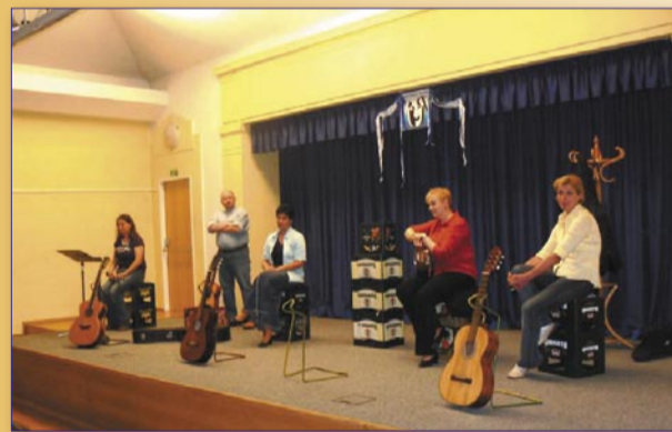
A nyní? V roce 2009 se stal součástí Radotínského pábení divadelní festival Radotínská Radost. Na snímku je pořadatel soubor Gaudium (tehdy tříletý)