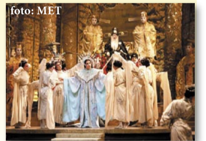
Kino Radotín uvede záznam z Metropolitní opery v New Yorku v neděli 15. března 2015 v 17.00 hodin. Délka: 2 hodiny 20 minut (1 přestávka)

Dirigent: Andris Nelsons Režie: Franco Zeffirelli Účinkují: Maria Guleghina, Marina Poplavskaya, Marcello Giordani, Samuel Ramey