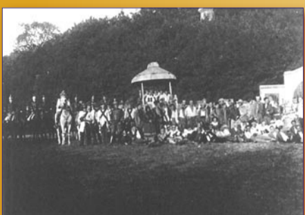
Výprava letních představení byla opravdu velkolepá (malý nebyl ani ansámbl, který zahrnoval mimo jiné i lochkovskou selskou jízdu)