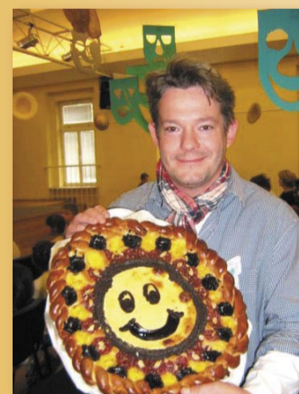
Patronát nad druhým ročníkem převzal známý herec a moderátor Ales Háma, který se sem znovu vrátil v roce 2013

V roce 2011 na Radosti vystoupil i host ze zahraničí - soubor z Litvy Teatriukas (divadélčko) dokázal i přes jazykovou bariéru rozesmát malé i velké obecenstvo