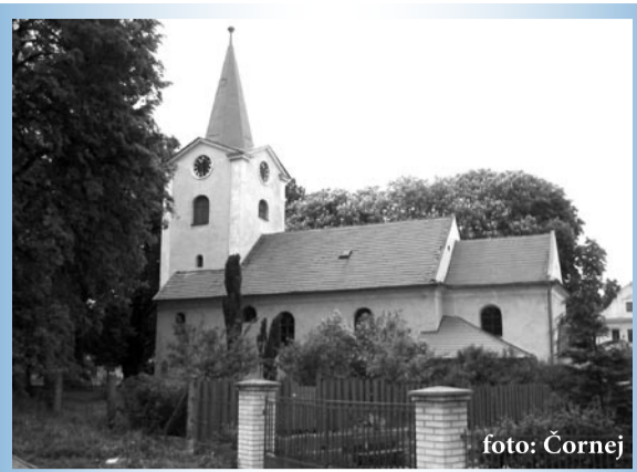
Ondřejov, kostel sv. Šimona a Judy

(4,5 km). K samotné zřícenině je to po krátké značené odbočce jen kousíček do vršíčku (0,2 km). Vršek