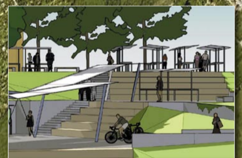
Projekt Místo u řeky