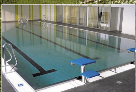
Projekt školního bazénu s využitím pro veřejnost