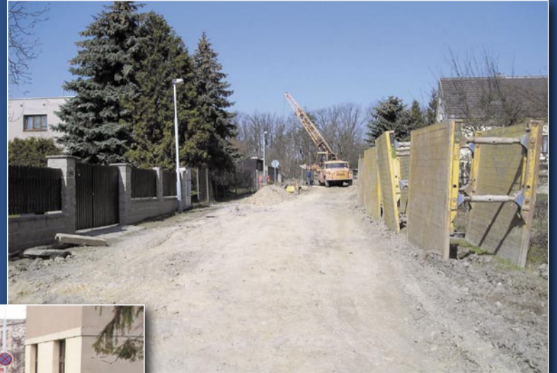
Zdická, Zadovská, Vojetická 40 mil. Kč