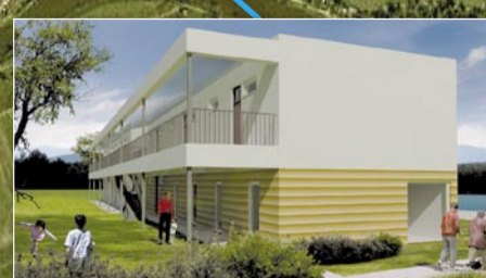
Malometrážní byty pro začínající rodiny