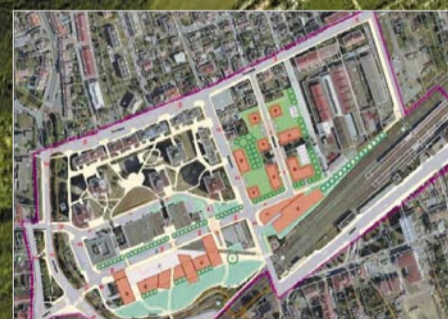
Projekt Centrum Radotín