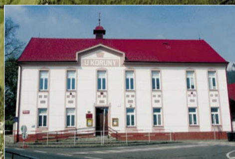
Vybudování klubové scény v suterénu kulturního střediska