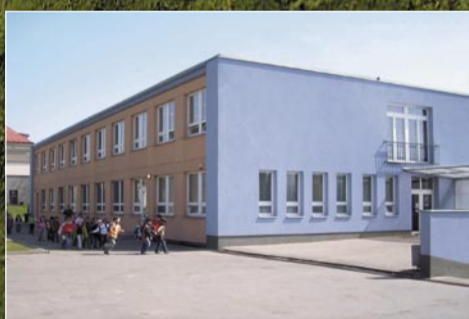
Rozšíření zázemí pro školní družinu a I. stupeň ZŠ