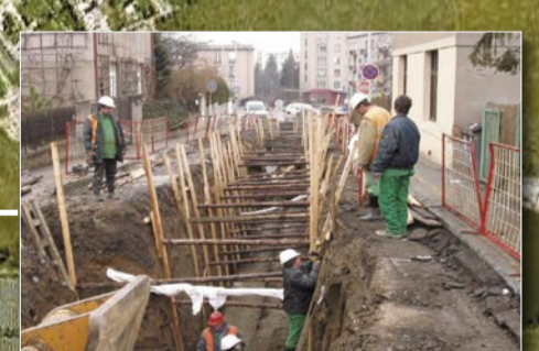
Úplné dokončení technické vybavenosti