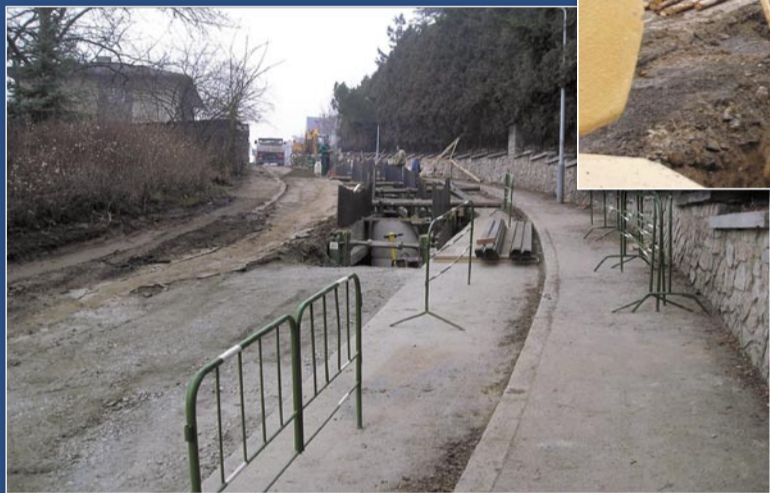
Jelenovská, Ofínská, Na Výšince 20 mil. Kč