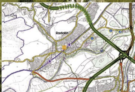
Obchvat Radotína s napojením dopravy na Strakonickou ul.